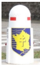
Borne du Serment de Koufra Schwenheim Kilomètre 1067