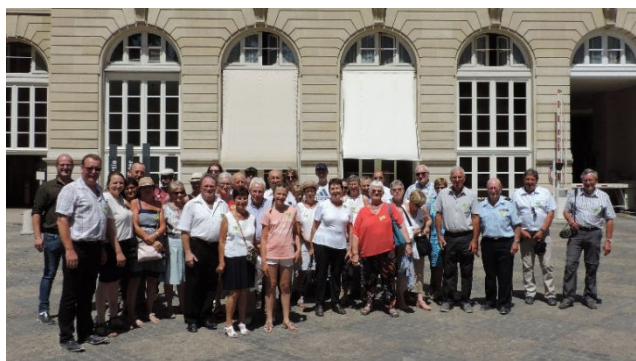
Ravivage de la Flamme

Le Groupe des Anciens Sapeurs-Pompiers et la Chorale