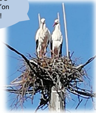
Nid rue de la Paix

Pense à dire à la Mairie qu'on est partis!